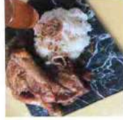
Poulet thaï frits avec riz gluant 10 €

Savourez l'authenticité de notre cuisine thaïlandaise, préparée maison avec des produits frais. Pour garantir la meilleure qualité, nous vous recommandons de passer commande un jour à l'avance.