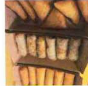
Nem et Samoussa 1,20€ par pièces