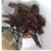
Porc thaï frit avec Riz gluant 7,50€