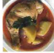
Poulet Massaman Curry avec Riz thaï 12,50€