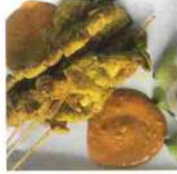
Porc satay à la sauce coco/cacahuètes 10€