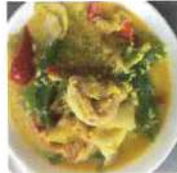
Gambas au curry avec riz thaï 12,50€