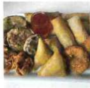
Plateau de YimYim 18 pieces 20€