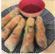
Rouleaux de printemps 2,50€ par pièce