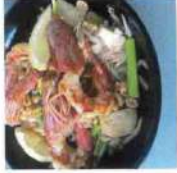
Pad thaï au gambas 12,50€