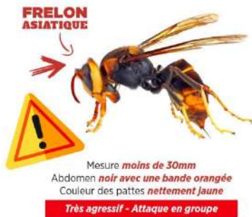
Mesure moins de 30mm Abdomen noir avec une bande orangée Couleur des pattes nettement jaune Très agressif - Attaque en groupe

Les frelons asiatiques sont chez nous : veuillez contacter la mairie si vous en repérez.