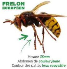
Mesure 35mm Abdomen de couleur jaune Couleur des pattes brun rougeâtre